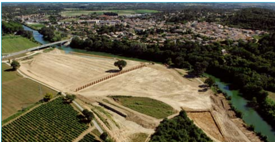
Peigne à embâcles et zone d'expansion de crue

- Une zone d'expansion de crues en amont du pont de la déviation de Sommières, pour limiter l'impact des inondations, sur Sommières et les zones urbanisées.