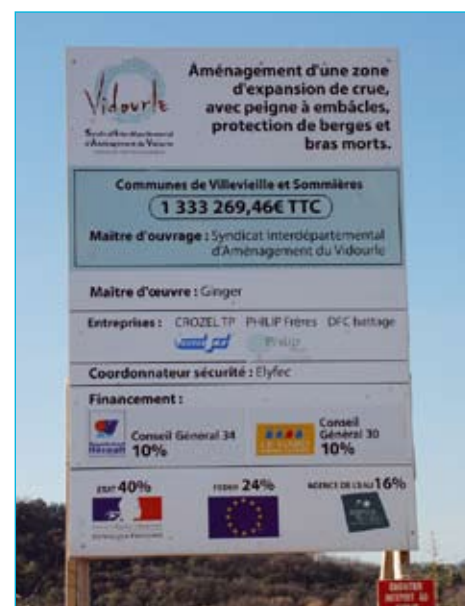
Panneau de Chantier

Préservation du captage des eaux potables sur la commune de Villevieille.