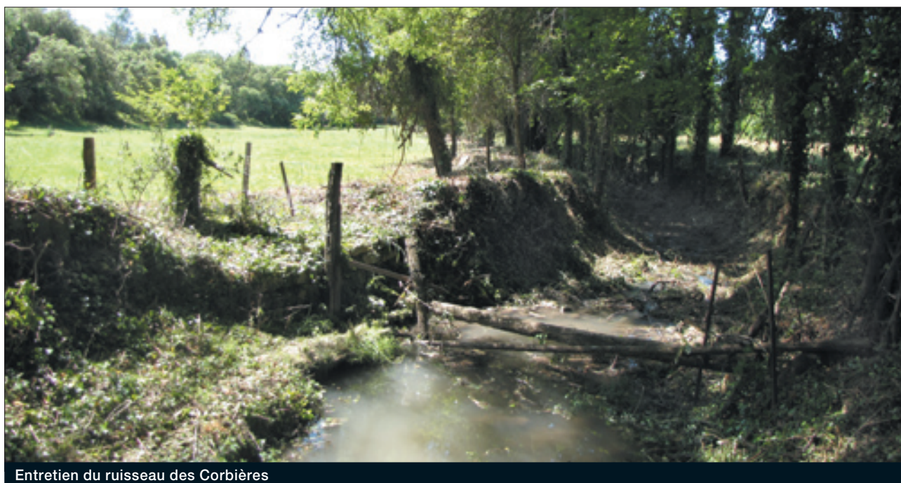
Entretien du ruisseau des Corbières