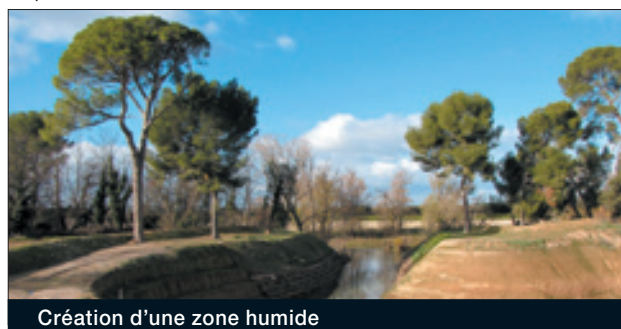
Création d'une zone humide