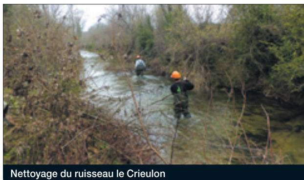
Nettoyage du ruisseau le Criulon

Communes concernées : Aujargues, Junas, Villevieille, Sommières.