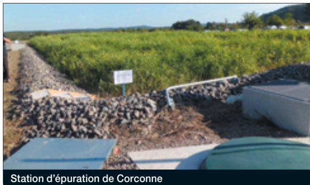
Station d'épuration de Corconne

Les travaux sont financés par les Conseils généraux du Gard et de l'Hérault et également par l'Agence de l'Eau Rhône Méditerranée.