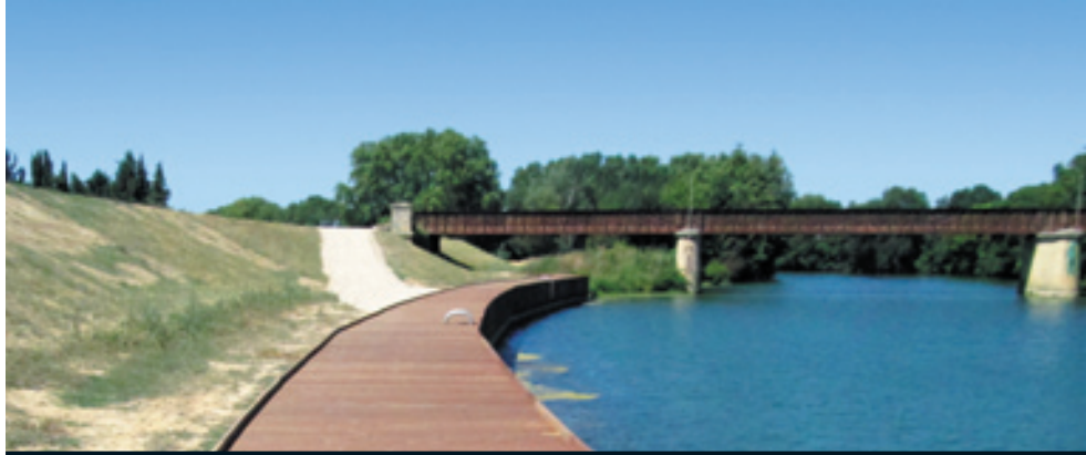
Confortement de la digue de Marsillargues

Etablissement Public Territorial de Bassin