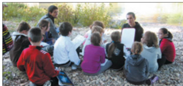
Sur les berges du Vidourle, en amont du pont Tibère à Sommières, les élèves découvrent le milieu naturel