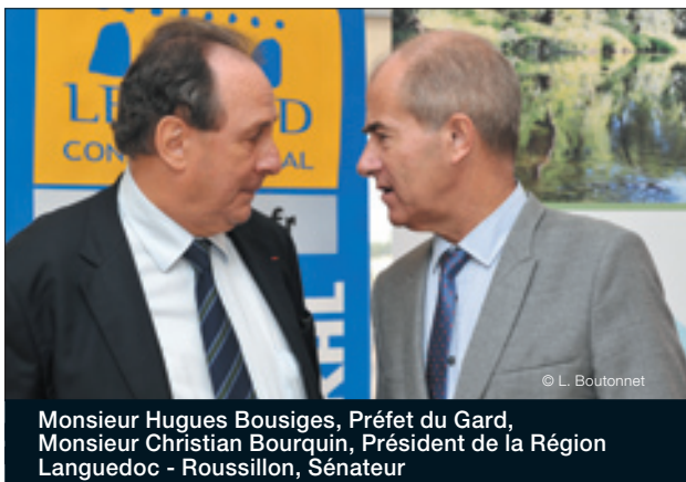
Monsieur Hugues Bousiges, Préfet du Gard, Monsieur Christian Bourquin, Président de la Région Languedoc - Roussillon, Sénateur

Le 26 septembre 2013, Hugues Bousiges, Préfet du Gard et Christian Bourquin, Président de la Région Languedoc-Roussillon, Sénateur, ont participé à la réception finale du chantier de confortement des zones de surverse de la Digue classée B de Gallargues le Montueux, réalisé par l'EPTB Vidourle dans le cadre du PAPI1 (Plan d'Actions et de Prévention des Inondations).