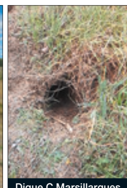
Digue C Marsillargues observation de terrier susceptible d'affaiblir l'ouvrage