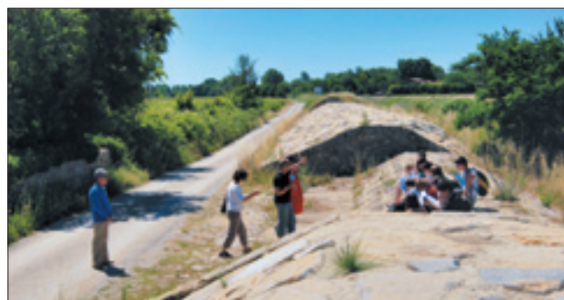
Sur la commune de Gallargues le Montueux les élèves découvrent le fonctionnement des digues Pitot