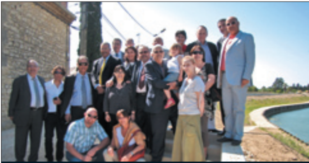
La délégation marocaine et le CG34 en visite sur le chantier de la digue de Marsillargues réalisé par l'EPTB Vidourle.

Le Conseil Général de l'Hérault a reçu cet été, une délégation marocaine de l'Institut Méditerranéen de l'Eau. Ils ont souhaité visiter des travaux hydrauliques sur l'étang de l'Or et sur le bassin du Vidourle. A ce titre, l'EPTB Vidourle a commenté sur site le chantier de confortement de la digue classée B de Marsillargues.