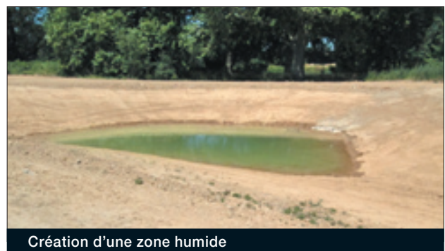
Création d'une zone humide

Ce projet a pour spécificité de concilier protection contre les inondations et conservation du milieu naturel. En effet, au titre des mesures compensatoires imposées par le dispositif Natura 2000, l'EPTB a créé une zone humide (une mare), pour favoriser la préservation des espèces.