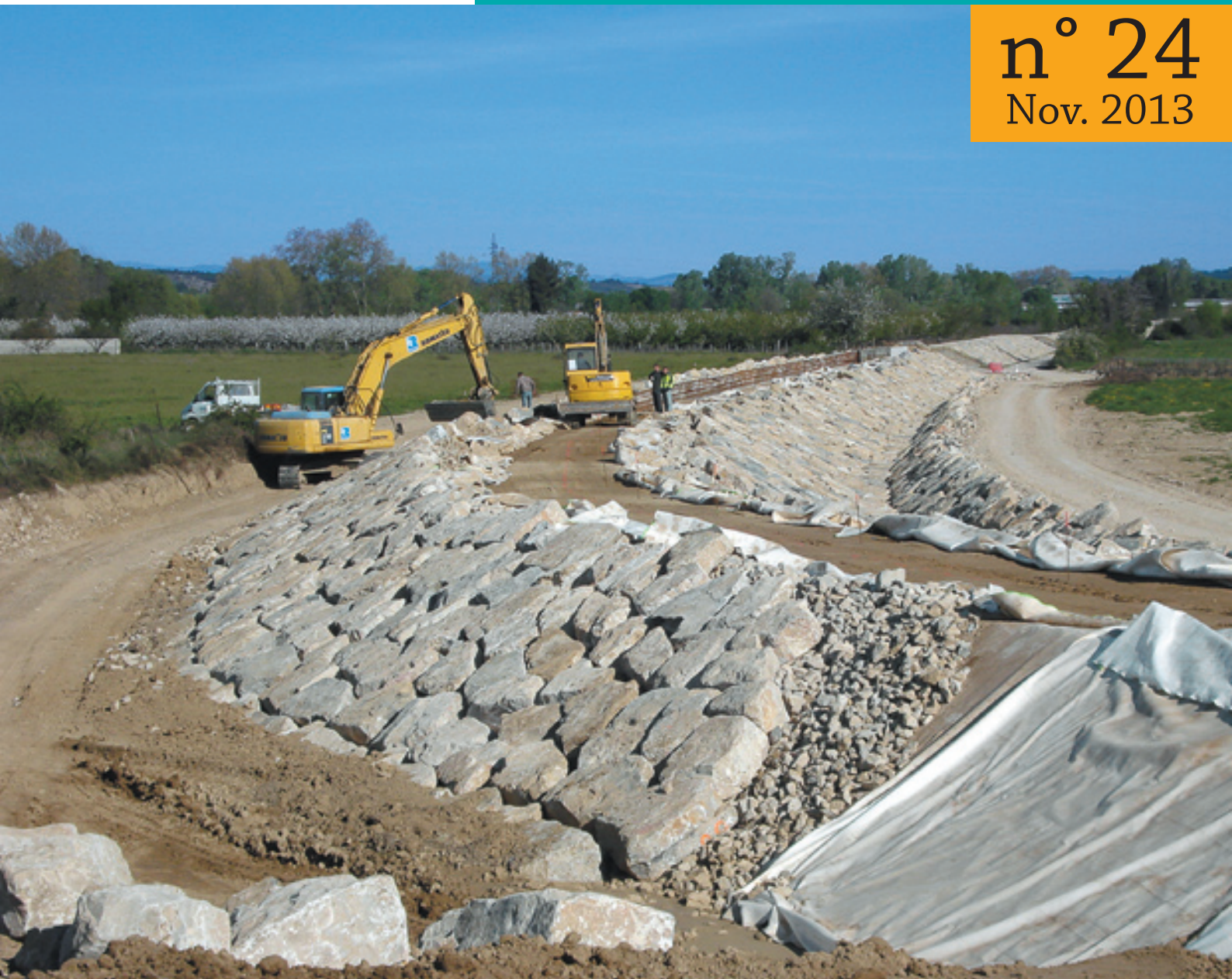
Confortement des zones de surverses de la digue de Gallargues le Montueux

Plan Vidourle : Réception des chantiers de Gallargues le Montueux et Marsillargues | Les 100 actions de l'EPTB Vidourle au service de la population Contrat de rivière : Bilan 2013 et perspectives 2014