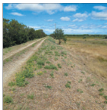
Digue C Aigues mortes affaissement de la crête et du talus aval

Exemples d'observations relevées par l'EPTB Vidourle sur le terrain :