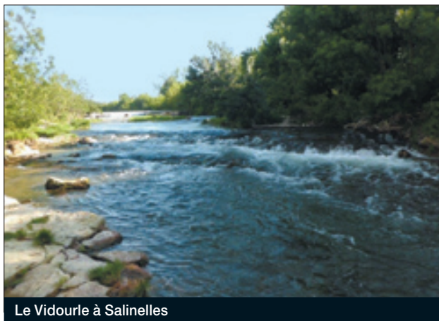
Le Vidourle à Salinelles

L'EPTB Vidourle a organisé, à Quissac, une réunion sur l'avancement de la procédure du Contrat de Rivière en présence du Vice président de l'EPTB Vidourle, Président du Comité de pilotage du Contrat de Rivière et conseiller général du Canton de Lunel, de nombreux élus, conseillers généraux, des représentants des services de l'Etat et de l'Agence de l'eau ainsi que des associations.