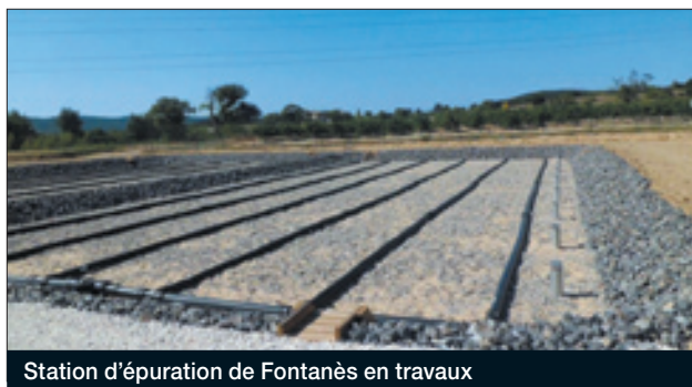
Station d'épuration de Fontanès en travaux