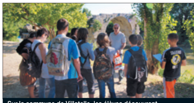
Sur la commune de Villetelle, les élèves découvrent les vestiges romains du pont Ambrussum